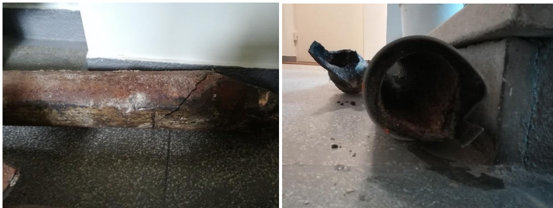
Korozja żeliwnych rur kanalizacji sanitarnej w jednym z naszych budynków

Udało się także wymienić kolejny stary żeliwny pion kanalizacyjny. Tym razem w budynku przy ul. Lipowej 9. Rozpoczęliśmy także prace przy instalacjach kanalizacyjnych, zlokalizowanych w piwnicach budynków, co niewątpliwie poprawi ich stan techniczny i komfort mieszkańców.