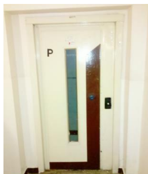
Stara winda w budynku Radna 15

W latach 2011, 2012 i 2013 na wszystkie potrzebne remonty wydano łącznie kwota ok. 2.487.500,00 zł, a do sierpnia 2014 już prawie 600 tys. zł. Wymieniono 9 wind osobowych, a wymiana 10 windy (Radna 9) jest w toku.