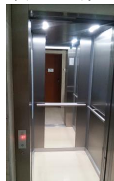
Nowa winda w budynku Radna 15